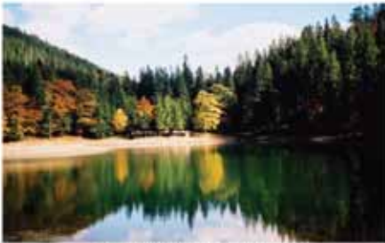
12. ábra: Szinyevéri-tó