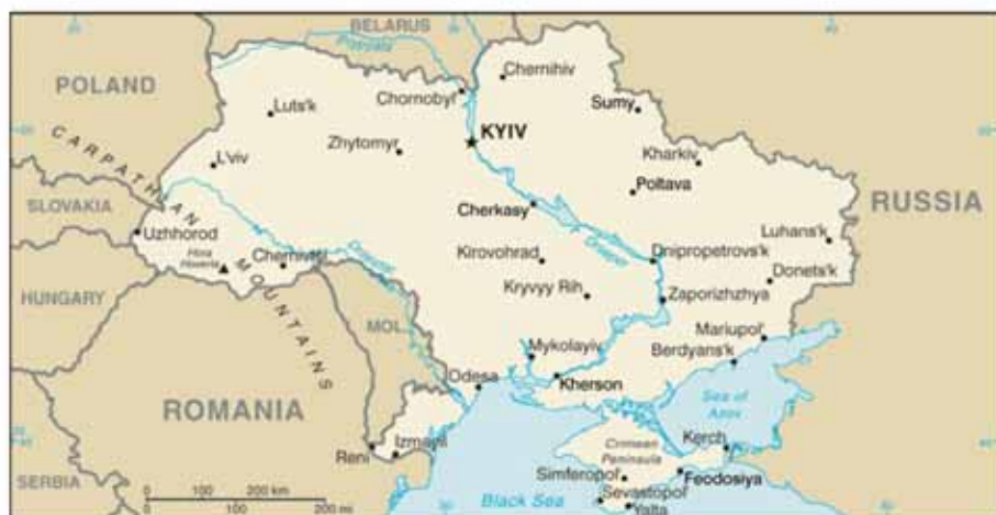
4. ábra: Ukrajna