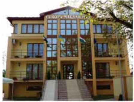
9. ábra: Európa Ház