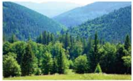
13. ábra: Kárpátok