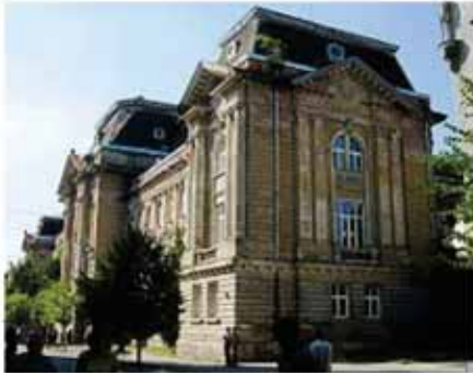
8. ábra: Kárpátaljai Tanárképző Főiskola