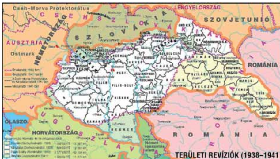
3. ábra: területi revíziók