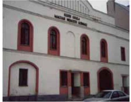
11. ábra: Illyés Gyula Színház