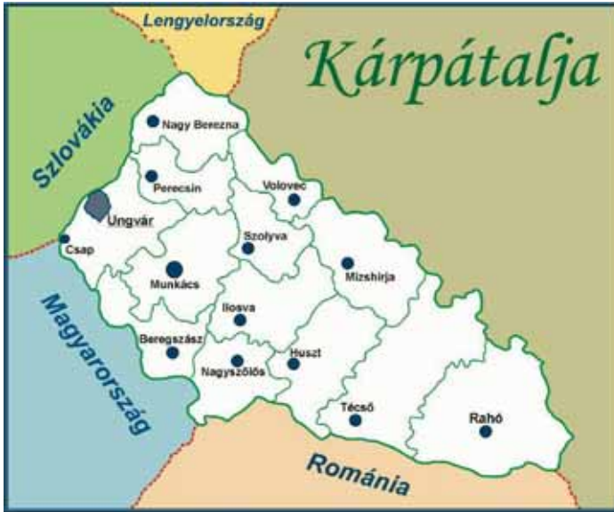
1. ábra: Kárpátalja