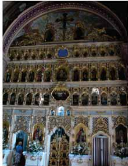
7. ábra: a katedrális belseje