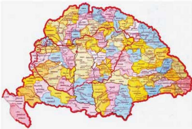
2. ábra: Nagy Magyarország