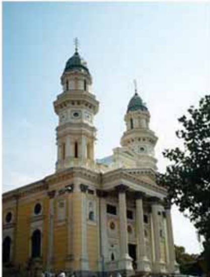
6. ábra: ungvári görög katolikus katedrális